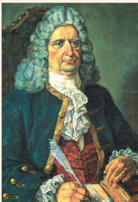
Г. Ф. Миллер.