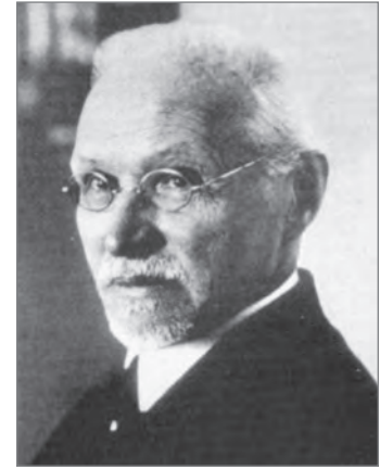
С. Ф. Платонов.

университета в здании Двенадцати коллегий шествовали, прежде чем разойтись по своим аудиториям, профессора Сергеевич и Бестужев-Рюмин, они одинаково свободно рассуждали и на исторические, и на историко-юридические темы. Вклад Константина Дмитриевича Кавелина (1818–1885), Василия Ивановича Сергеевича (1832–1910), Александра Дмитриевича Градовского (1841–1889), Михаила Александровича Дьяконова (1855–1919) и многих других в развитие исторического знания трудно переоценить.