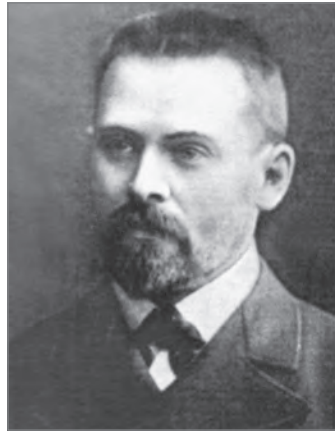
А. С. Лаппо-Данилевский.