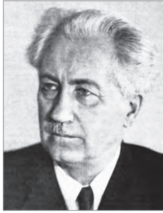
Б. Д. Греков.