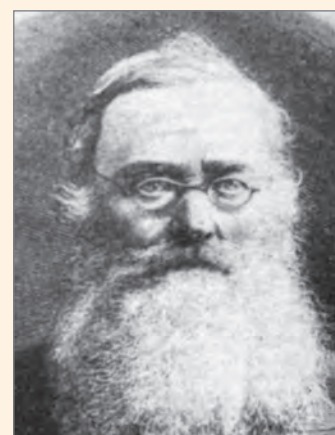
Н. И. Костомаров.