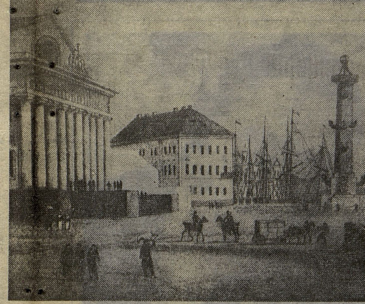
Строганов дом (справа), где помещались академический Университет и Гимназия. С литографии художника А. Е. Мартынова. (Начало XIX века).

ВСЕ НАЧАЛОСЬ здесь в 1703 г., когда на Заячьем острове была заложена Петропавловская крепость. Благодаря богатырским усилиям, неисчислимым жертвам, поту и крови рабочих людей, солдат и матросов «по низким толким берегам» воздвиглись жилые дома, пенковые амбары, лавки, канатные сараи, кузницы, рынки, бани и трактиры. Со сказочной быстротой менялся ландшафт островов в дельте Невы. Россия вышла к Балтийскому морю и «неугой твердой» стала на его берегу.