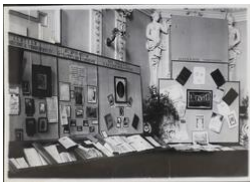
Юбилейная выставка по истории университета в Петровском зале (1939)