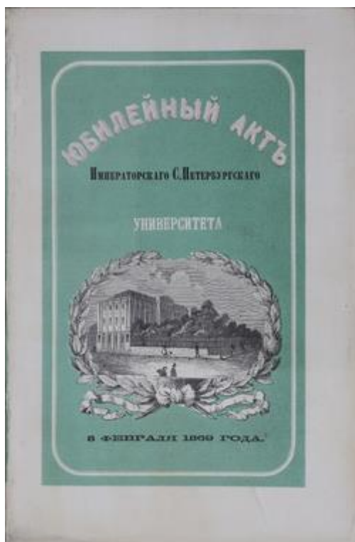
Обложка издания "Юбилейный акт Императорского С.-Петербургского университета 8 февраля 1869 г."