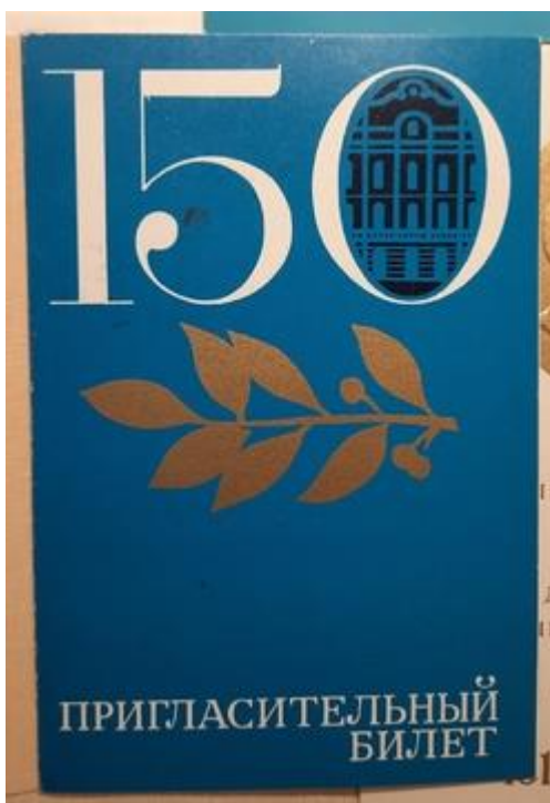
Обложка приглашения к участию в юбилейной научной сессии