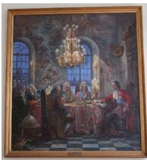
Картина Л.С. Давиденковой "Университету - быть!", написанная к 270-летию Санкт-Петербургского университета, открытие которой состоялось 18 октября 1994 г. в Главном коридоре здания Двенадцати коллегий