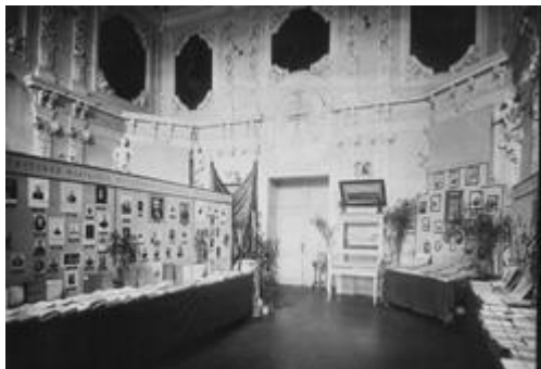
Выставка по истории Ленинградского университета. Петровский зал (1939)