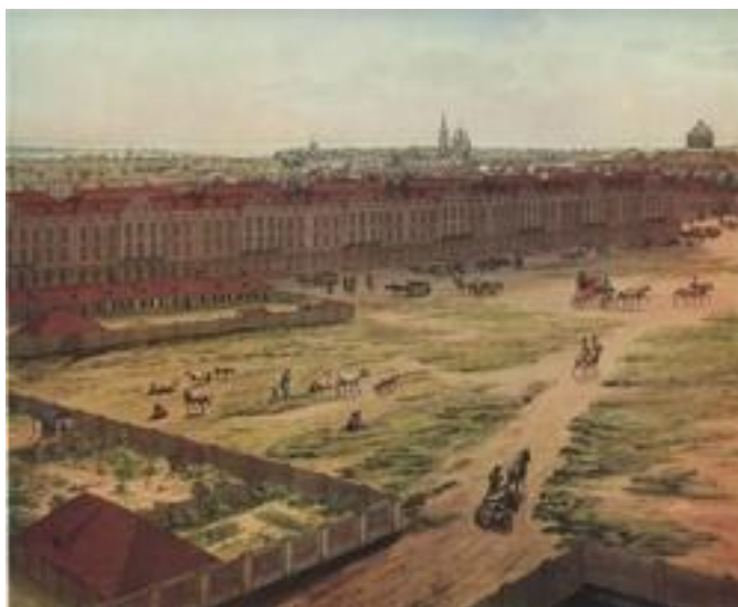
Здание Двенадцати Коллегий. Акварель Анжело Тозелли ("Панорама Петербурга". 1820 г.)