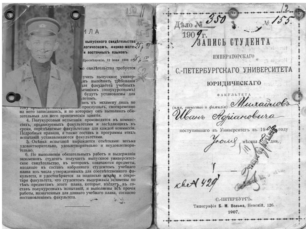
Запись студента ЦГИА СПб. Ф. 14. Оп. 3. Д. 53915. Л. 11–12.

хайлов) и П.А. Сорокин (по кафедре уголовного права) 16 .