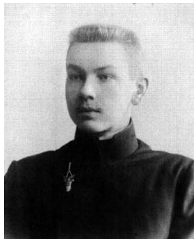
А.Ф. Малов. Фото 1909 г. (ЦГИА СПб Ф. 14. Оп. 3. Д. 63206. Л. 26)

с историей. Можно предположить, что это обстоятельство способствовало пробуждению в мальчике интереса к историческим штудиям.