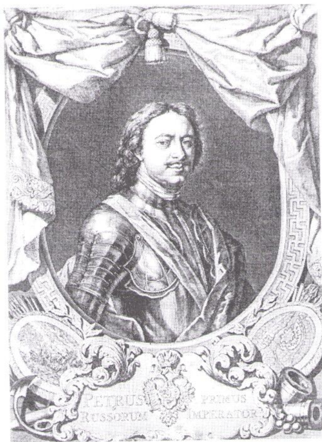
Репродукция из книги «Галерея Петра Великого в Императорской Публичной библиотеке». СПб., 1903 г.

М осква и Санкт-Петербург как две российские столицы всегда являлись и крупнейшими центрами отечественной науки и образования. Именно в них зарождалась высшая школа России, и, естественно, оба центра всегда были тесно связаны между собой, произрастая из единых корней.