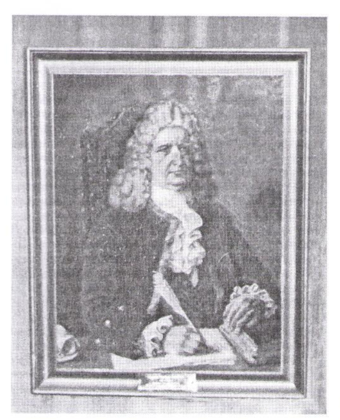
Портрет Герарда Фридриха Миллера работы Э.Козлова.

ерард Фридрих Миллер (1705-1783) – уроженец Вестфалии — одной из германских земель, получил степень бакалавра в Лейпцигском университете: при открытии Академии наук был приглашен в Россию и вскоре получил должность преподавателя латинского языка, истории и географии в академической гимназии.